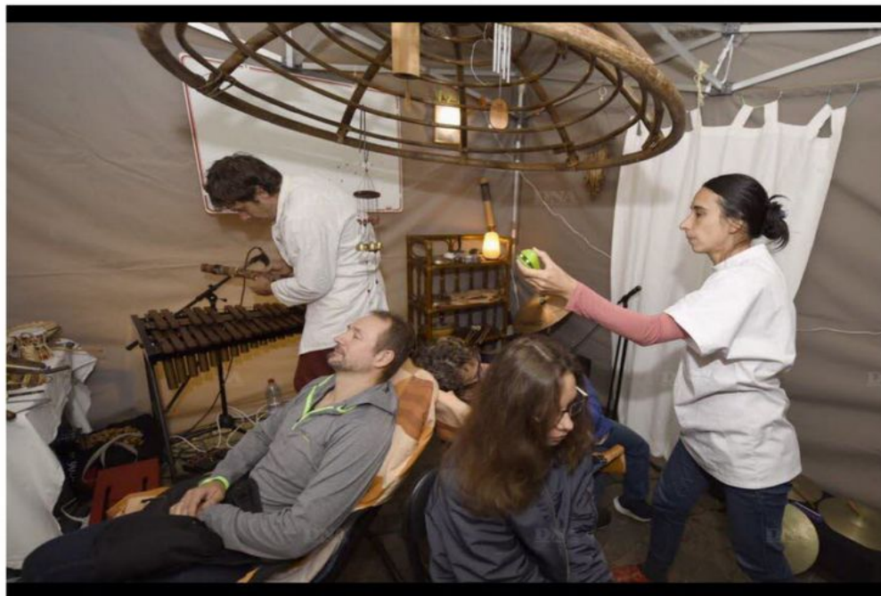
Thérapie sonore en cours, ne pas déranger.

Samedi soir, un drôle de cabinet médical s'est installé devant la librairie La Marge, dans le cadre de la nuit de la culture de Haguenau.